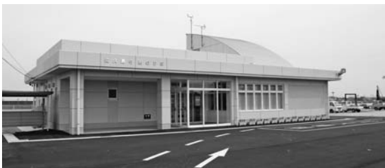
佐久島行船のりば

特別ダイヤ (23年度) 4月29日(祝)～5月8日(日)、 7月20日(水)～8月20日(土)、7月～10月の土曜日・日曜日・祝日