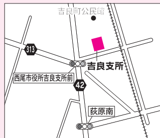
▲吉良支所…吉良町荻原川畑 20番地 / ☎32・1111 (代表)