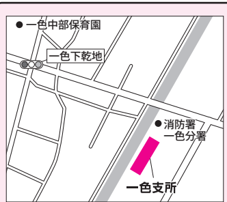
▲一色支所…一色町一色伊那 跨61番地 / ☎72・7111 (代表)