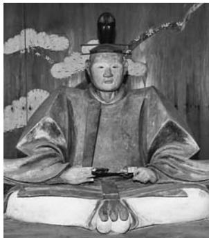
吉良義央 上杉定勝の子三姫と婚姻。三之助を上杉家の養子とした後、その子春千代を吉良家の養子として吉良家と上杉家との義の系譜をつくる。