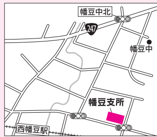
▲幡豆支所…西幡豆町仲田14 番地 2 / ☎62・5511 (代表)