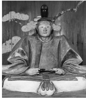
吉良義央 上杉定勝の子三姫と婚姻。三之助を上杉家の養子とした後、その子春千代を吉良家の養子として吉良家と上杉家との義の系譜をつくる。