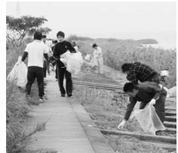
▲昨年の活動の様子