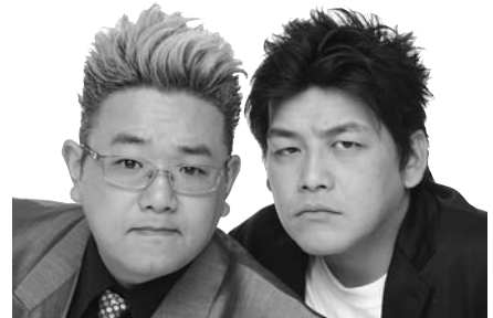
●サンドウィッチマン…伊達みきお（左）と富澤たけし（右）のお笑いコンビ。共に宮城県仙台市出身。みやぎ夢大使にも任命されている。

問合せ先 きらまつり実行委員会（☎32・1141 / 西尾みなみ商工会内）、市観光協会（☎65・2169 / 商工観光課内）