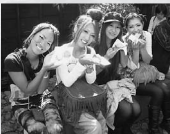
▲昨年のお茶会の様子。散策途中に立ち寄った大葉邸でかしや餅をいただく観光客の方々です。

今年で6回目の開催となる「かしや餅づくり」は、佐久島伝統の素朴な和菓子「かしや餅」を、島民の指導でつくる体験ができます。 この「かしや餅」、端午の節句の供物として知られています。「かしわ餅」と名前は似ていますが、素材は全て違います。島では、手に入る材料に限られていたためです。島にあるものでつくる先人の知恵が生かされていると、実際につくることで体感できます。使われている餡や葉に注目してみてください。 つくった「かしや餅」は築100年の民家が丸ごとアート作品となった「大葉邸」の