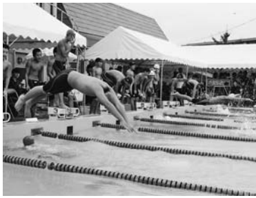
▲昨年の大会の様子