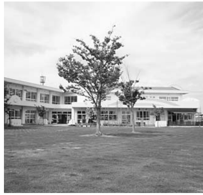
芝生化された八ツ面保育園

答 公立の保育園、幼稚園の全園に手挙げ方式で応募していただき、三和、荻原、白浜の3保育園で県費補助により実施を予定しています。