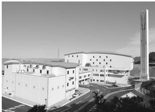
西尾市クリーンセンター

答 愛知県の指針により、岡崎市、幸田町、西尾市で平成25年度末を用途に協議会を立ち上げ、一定の方向性を示します。