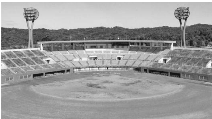
岡崎中央総合公園 市民球場(岡崎市提供)

答 提言は重く受け止めています。構想については、しっかりと調査研究していきます。