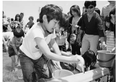
▲昨年行われたうなぎつかみ大会の様子

問合せ 三河一色うなぎまつり実行委員会事務局（商工観光課内）、一色うなぎ漁業協同組合（☎72・8847 / 一色町）