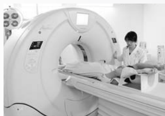
▲今年2月に更新した80列マルチスライスCT装置

CT撮影検査の多くは患者さまに呼吸を止めていただく必要がありますが、従来に比べて呼吸を止める時間が半分以下になり、負担を軽減することができます。また、細かい血管の観察や骨折の評価が可能になり、適用範囲がさらに広がりました。被ばくに関しても、患者さまそれぞれの体格を考慮し、診断に必要な最小限のエックス線量を決める機能などで、撮影部位によっては最大で6割程度低減できるようにしました。今後も放射線科専門医と連携を取りながら、装置の特性を最大限生かして、受診される患者さまにとって、より苦痛が少なく、安心できる検査を提供できるように心がけていきます。