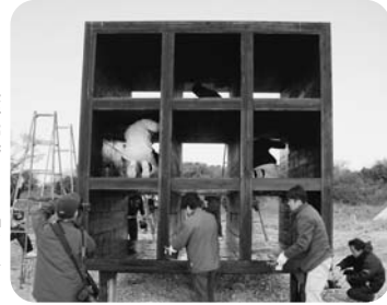
▶黒壁運動で「おひるねハウス」もお色直し

私たち「島を美しくつくる会」は、佐久島の自然や風土、歴史、産業など固有の資源を発掘や研磨して、島の活性化を推進することを目的に平成8年に設立しました。メンバーは島民全員で構成し、現在は279人。島外の方たちとも協力しながら活動をしています。