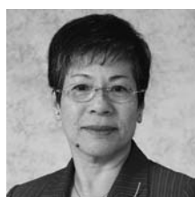
「もり」当る。りター災害支て。市センター。盛岡市長。岡性一被災走。県女性被から復。岩おセ初興