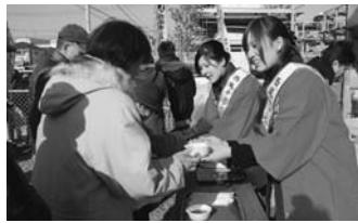
▲昨年の無料サービスの様子