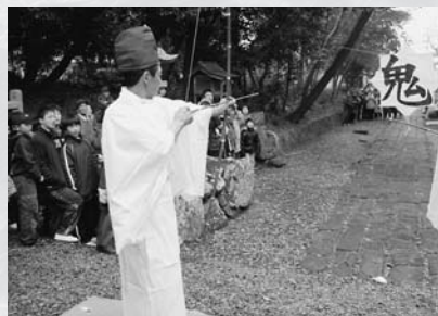
▲弓矢で「鬼」と書かれた八角凧を射る瞬間。皆、息をのみながら見守ります

佐久島伝統の祭り「八日講祭り」は、弓矢によって邪気を払い、無病息災を祈願する奇祭です。この祭りは、毎年1月8日に行われるため、島民からは「八日講」と呼ばれ親しまれています。250年ほど前から行われていたと伝えられ、舞台となるのは東地区の八剣神社です。境内には邪気象徴として「鬼」と書かれた八角凧がつけられます。拜殿ではいろいろな祝詞などの神事が行われた後、古式ゆかしい白衣と黒烏帽子に身を包んだ2人の厄男が、交互に2回ずつ呪文を唱えながら弓矢で八角凧を射ます。その凧