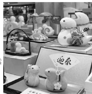
▲昨年の郷土玩具と干支展