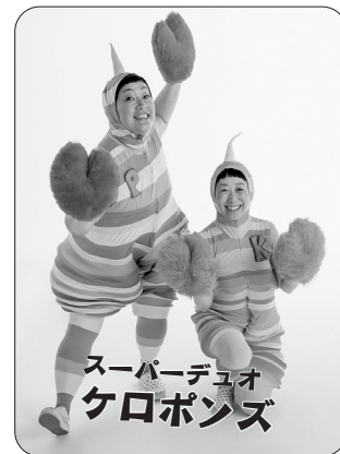
スーパーデュオ ケロポンズ

日時 12月1日(日) 午後 1時30分～3時30分 ※午後1時開場。 場所 文化会館大ホール 入場料 3歳以上500円(全席自由。3歳未満 でも席が必要な場合は有料)