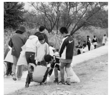
▲昨年の活動の様子