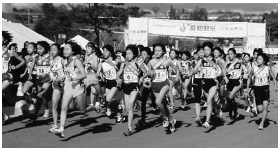
◀県内54市町村が一斉にスタート。手に汗握る白熱のレース

愛知万博メモリアル第8回愛知県市町村対抗駅伝競走大会が、12月7日(土)に愛・地球博記念公園で開催されます。そこで、市の代表選手を決定するための選考会を行います。選考会は2回(小学生は3回)にわたって開催しますので、ぜひご参加ください。