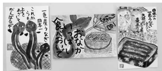
▲昨年の絵手紙コンテストのグランプリ作品

応募・問合せ先 市観光協会 (☎65・2168/〒445-8501住所不要/✉shoko@city.nishio.lg.jp/商工観光課内)