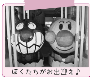
ぼくたちがお出迎え♪