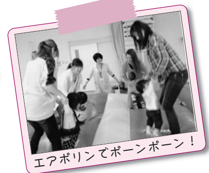
エアポリンでポーンポーン！