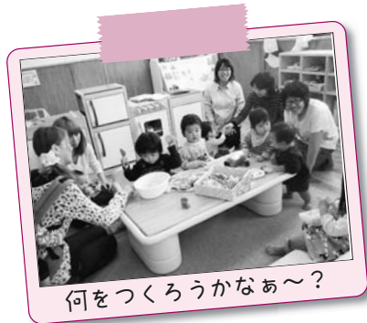
何をつくろうかなあ～？