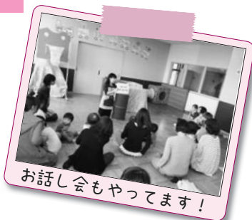
お話し会もやってます！