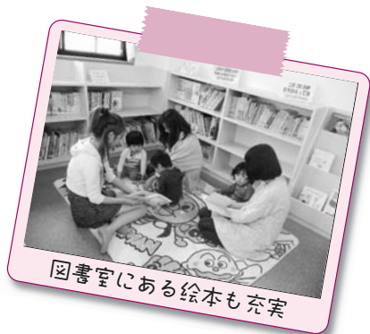
図書室にある絵本も充実

23年3月にリニューアルした中央児童館。隣の公園も新しくなり、広くてきれいな屋内外で伸び伸びと遊べます。就園前の子どもたちは、ジャングルジムやサーキット、ままごなどが楽しめます。小学生は卓球やドッジボール、バスケットゴールへのシュートなど、体を動かしながら遊べます。また「ギネスに挑戦」「文字あそび」などで友達と協力したり、競い合ったりして友情が深まります。 毎日いろいろな催しがあり、たくさんの子どもたちが気軽に、楽しく参加できます。