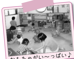
おもちゃがいっぱい♪