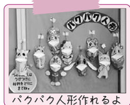
パクパク人形作れるよ

吉良児童館は、幼児からお年寄りまでさまざまな方と接することができ、アットホームな雰囲気の中で遊べます。「ちびっ子集まれ」をはじめ、手遊び、読み聞かせ、親子体操、リトミックなど親子向けの行事も豊富で、毎日いろいろな遊びを行っています。また、小学生以上の子どもたちもたくさん工作やドッジビー、エアポリンなどを体験し、遊びを通して新しい友達との出会いが広がります。 「なつまつり」「クリスマス会」など笑顔いっぱいのイベントもあります。