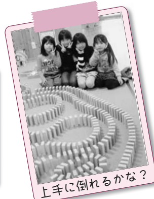
上手に倒れるかな？