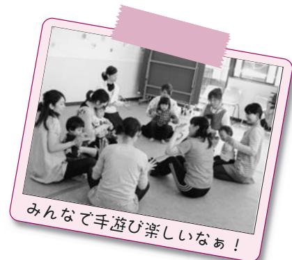
みんなで手遊び楽しいなあ！