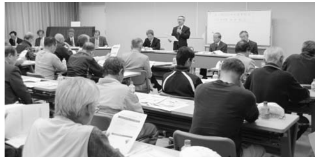
▲西小校区町内会長連絡会平成25年度第1回総会にて、第7次西尾市総合計画、名鉄西尾・蒲郡線存続に向けての事業などについて説明しました。