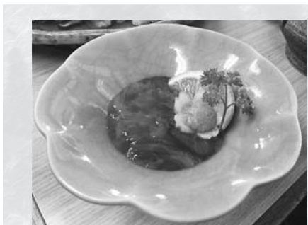
▲「このわた」…ナマコの内臓のうち、腸の部分を塩辛にしたものです

ウニ、カラスミと並び日本三大珍味として知られる「このわた」が、佐久島の冬を代表する味覚であることをご存知ですか。佐久島のこのわたは江戸時代から現在に至るまで独自の製法を受け継いでおり、古くは徳川幕府に献上されるなど歴代の将軍も舌鼓を打った極上の珍味なのです。このわたとはナマコの腸の部分に塩辛にしたもので、語源は「ナマコのはらわた」からきています。ナマコは12月から3月にかけて、佐久島周辺の磯で獲れるため、佐久島の冬の主要海産物です。その漁獲方法は船