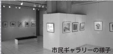
市民ギャラリーの様子

▶開館時間…午前9時～午後5時 ▶休館日…月曜日。月曜日が祝日の場合は火曜日も休館 ▶入場料…無料 ※市民ギャラリーに展示したい方は、利用する週の月の6か月前の月始めに、直接岩瀬文庫へ。先着順。電話での申し込みはできません。