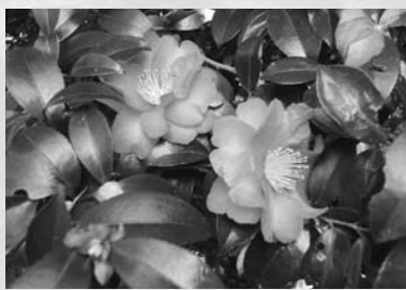
▲ピンクの花がかわいいサザンカ。花びらが風で舞い始めると、島は冬本番を迎えます。

冷たい風が吹き、外出するのが少し面倒になる季節ですが、そんな中でも、島の森の散策道を歩けば、木々が風をさえぎり、それほど肌寒くはありません。 散策の道中でのオススメは、島の西地区に位置する白山神社の参道で咲くサザンカ。枯れた木立にひととき映えるピンクの花は、花びらが風に舞い、道に落ちると、そこはピンのくじゅうたんとなります。また、赤い実が鮮やかで、冬でも葉が青々しているセンリョウやマンリョウも、たくさん眺めることができます。 もうひとつのオススメは、島のあちこちで咲くスイセン