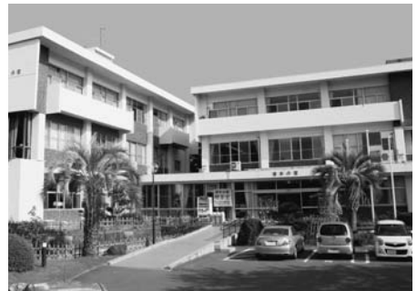
中央ふれあいセンター

でき、夜間、土・日曜日、祝日の変則勤務が可能な65歳未満(27年4月1日現在)の方