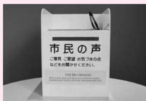
投書箱（設置場所により形が異なります）

市では、より良い市政を行っていくために、市民の皆さんから広く意見や要望などをお聞きする「市民の声」という制度を設けています。