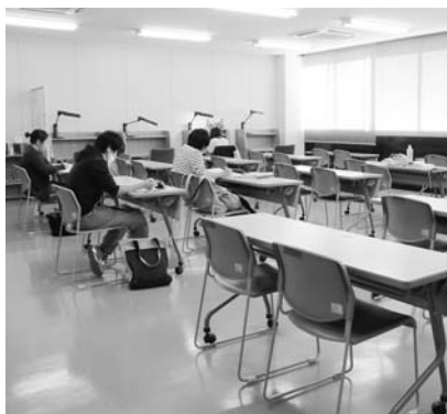
▲西尾市立図書館の学習室

西尾市には本館と分館(一色学びの館、吉良図書館、幡豆図書館)合わせて4館の図書館があります。本館には、利用者が図書館の本を使った調べものや、学習するための学習室を設けています。学習室が満席で、会議室が空いている場合は、施設の有効利用のため、会議室を学習室として開放しています。また、2階の一般利用者閲覧コーナーの一部も開放し、ご利用いただいています。本館での学習席の確保はこれ以上は困難ですが、分館にも学習席として開放しているスペースがありますのでご利用ください。(図書館)