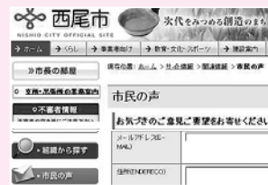
市ホームページ内の入力フォーム