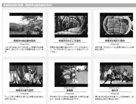
▲西尾紹介動画は市観光協会ホームページ「トップページ」→「パンフレット」からご覧いただけます

現在、市の観光案内は市観光協会ホームページで案内しています。その中で動画共有サービス、YouTubeを通じて「西尾紹介動画」も配信し、見どころや味わい、祭りを紹介しています。ご提案の外国人向けの動画配信や動画サイトの立ち上げは、外国人観光客を誘致していく上で、面白い取り組みだと賛同します。今後ホームページの外国語表記を増やすとともに、外国人目線による情報発信を検討する際の参考とさせていただきます。(商工観光課)