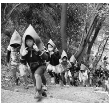
▲11月5日に実施された内閣府・西尾市地震・津波防災訓練で避難する児童の様子

津波避難の手段は、原則として徒歩をお願いしていますが、自動車による避難を一律に禁止しているのではなく、地域特性や要援護者の避難など、対象者を限定して対応すべきであると考えています。そのためには、地域住民の合意形成が必要であり、お住まいの地区の自主防災会は現在、危機管理課と津波避難のあり方を検討しています。また、ハザードマップは26年度中に作製して、全世帯に配布し、市ホームページに掲載するなど、津波避難に関する情報