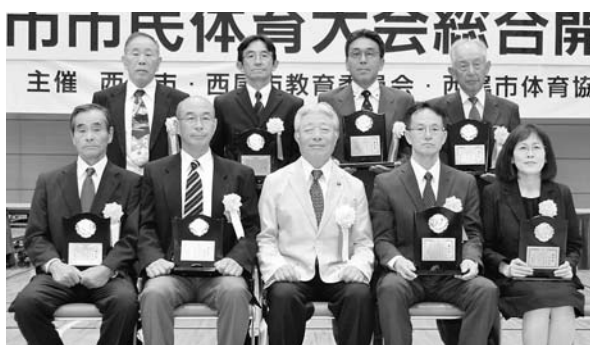
▶体育功労者の皆さん