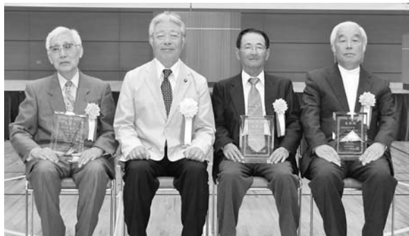
▶特別体育功労者の皆さん