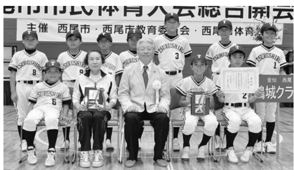
▶優秀選手・優秀チームの皆さん