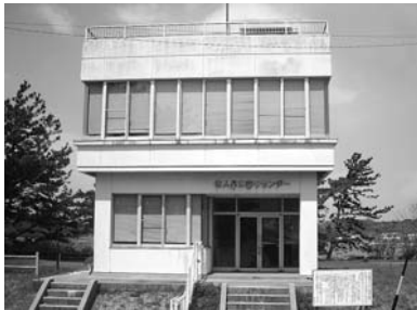
佐久島海釣りセンター管理棟

市の公共施設に係る具体的な再配置プランをまとめた「西尾市公共施設再配置実施計画2014→2018」に基づき、未利用とな