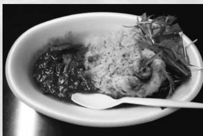
昨年の名物料理試食会メニュー「たこカレー」…佐久島で捕れた新鮮なタコを使ったシーフードカレーです

爽やかな陽気となるこの季節「く」の秋」という、定番のフレーズからさまざまなおはなしが連想されます。 佐久島では「自然の秋・太鼓の秋・食欲の秋」を満喫していただくため、たくさんのお客様を予定しています。 10月25日には「わくわく自然体験」として、海を渡り、長距離を移動するチョウ「アサギマダラ」の観察会を行います。生態を学んだ後、実際に捕獲して観察するため、お子さん連れでも楽しめます。 10月26日には、秋のイベントとして定着した「佐久島太鼓フェスティバル」を大浦海