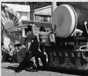
秋の恒例行事となった佐久島太鼓フェスティバル

佐久島の祭りといえば、夏の「弁天祭り」や秋の「白山十夜祭り」「秋の大祭」があります。いずれも、祭りの中心は昔から「佐久島太鼓」の奉納です。 佐久島太鼓のバチは「ブチ」と呼ばれ、形は野球のバットに似ていますが、途中で緩く曲がっています。太鼓そのものは、皮の張り方が緩めで低い音に特徴があり、心臓にまで響くような迫力があります。 佐久島太鼓は、島の若者や子どもたちに受け継がれ、大切に思われています。そんな島民の思いから「和太鼓で島を盛り上げよう！」という機運が高まり、平成21年の秋に「佐久島太鼓フェスティバル」