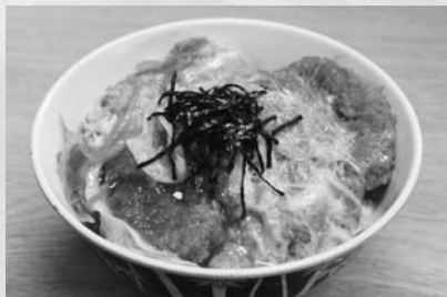
佐久島定番の大アサリ丼 お店によって味付けが違うので、お気に入りを見つけてみよう！

島のアートを巡った後の昼食は、やっぱり大アサリ丼。佐久島では、食堂や喫茶、海の家など、ほとんどのお店で食べることができる定番のメニューです。 大アサリ丼は、今から約40年前に佐久島で誕生したご当地メニューで、大アサリのフライを卵でとじた、見た目がカツ丼にそっくりな一杯です。 丼物の歴史は、日本食の中では浅く、江戸時代に天丼やうな丼が登場して、現代の丼ぶりの形が出来上がったといわれています。その後、文明開化と共に牛肉食の文化が根付くと、19世紀終わり頃に牛