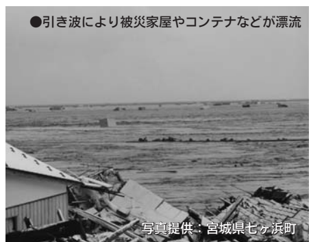
●引き波により被災家屋やコンテナなどが漂流

効果も想定されています。ただし、この減災効果は、①建物の耐震化率100%の達成、②家具などの転倒・落下防止対策実施率100%の達成、③全員が発災後すぐに避難開始、④既存の津波避難ビルの有効活用、の全ての対策が実施されたと仮定した場合の想定です。