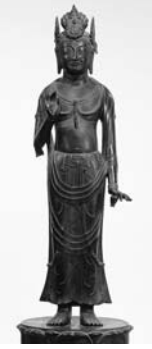
国宝「観音菩薩立像(夢違観音)」

※各種障害者手帳の交付を受けている方とその介助者は無料。 場所・問合先 岡崎市美術博物館(☎0564・28・5000/岡崎市高隆寺町)