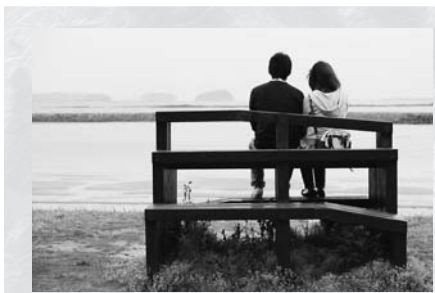
▲大浦海水浴場にあるベンチです。カップルに目を奪われがちですが、ベンチのデザインに注目してください

照りつける太陽、どこまでも広がる青空…いよいよ夏本番がやってきます。佐久島には暑さにも負けず、アート作品を中心に散策を楽しむ観光客がたくさん訪れます。そんな方たちの休憩場所となっているのが、島内の4か所に設置されているベンチです。これらのベンチは、アートプロジェクトの大学生が制作したもので、アート作品としても観光の重要な役割を担っています。大浦海水浴場には、アートの作品「カモメの駐車場」を見渡せる場所にベンチがありま