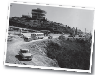
ミケ根山回転展望台と下ライプウエー(昭和39年)