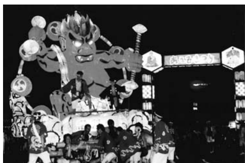
▲あさひまつりの様子

内容 回想法は認知症や閉じ こもりの予防や治療につな がる非薬物療法の一つです。 高齢者の記憶、特に誰もが 鮮明に覚えている子ども ころの記憶を引き出し、楽 しい時を過ごすことにより、 かけがえのない人生を送る ためのヒントを学びます。