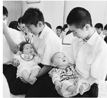
▲昨年の体験授業の様子

思春期の子どもたちの心を育てるために、中学生が乳児とふれあう授業を行います。協力していただける親子を募集します。 対象 生後2か月～1歳の子さんとその保護者 日時 5月19日(月)・20日(火)・