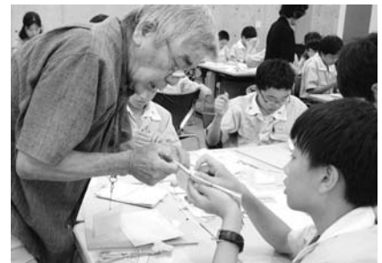
▲岩瀬文庫ボランティアの活動の様子

多くボランティアの新年度会員を募集します。まずは、説明会にご参加ください。 活動内容 蔵書の修理や講座の受け付け・アシスタント、ポスターの発送作業など