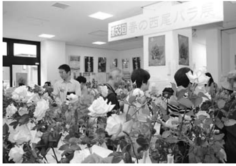
▲昨年の西尾バラ展の様子

色鮮やかなバラの展示や即 売を行います。母の日のプレ ゼントに、市の花であるバラ を贈ってみてはいかがでしょ うか。 日時 5月10日(出) 午前10時