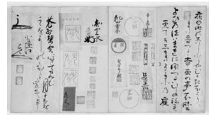
▲有名人の筆跡や印鑑などをまねたものが満載の「書画落款臨模帖」

岩瀬文庫の全資料調査も14 年目に入りました。今年度の 調査で見つけた成果や面白本