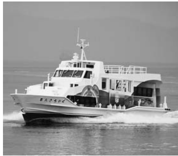
▲船内広告募集中の第三さちかぜ