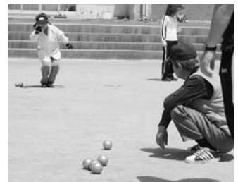
▲ペタンクは金属製の玉を投げ合い、目標球に近づけることを競うスポーツです

場所 吉良サンライズパーク 募集チーム数 1チーム3人の32チーム(先着順) ※男女不問、個人での申し込み可。個人の場合は主催者側でチーム編成。 参加料 1人1000円 ※当日お持ちください。