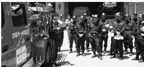
▲消防車などの操作方法を学ぶポンプ取り扱い訓練