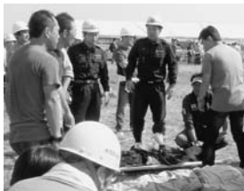
▲防災訓練で担架の使用方法を指導

消防団は、本業を持ちながら「自分たちのまちは自分たちで守る」を合言葉に、地域住民によって組織された非常備の消防組織です。全国全ての市町村に設置されていて、近年、その活躍が目まぐるしくなっています。災害発生時は消火活動、救助・救出活動、避難誘導などに従事し、平常時は消防・防災に関する知識を学んでいます。また、地域の防災訓練で、消防団活動で習得した知識の普及啓発を行うなど、地域の防災リーダーとしての役割を担っています。