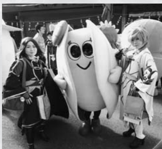
イベント会場ではコスプレヤーからも人気のあさりん(女子)

大アサリの形をした、アトが分かる佐久島生まれのゆるキャラ「あさりん」が誕生して、はや1年が経ちました。現在、「あさりん」は、佐久島をPRするため、ゆるキャラフェスティバルなど各地のイベントで精力的に活動しています。その成果として、イベント会場でいきなり名前を呼ばれて囲まれることも多くなりました(はじめは米粒やハマグリと呼ばれることもありました)。また、2枚貝の特徴を生かしたハグも子どもや女性を中心に大変人気となっています。 最近では、佐久島渡船の船内アナウンスも「あさりん」が行うことになり、そこで、こ