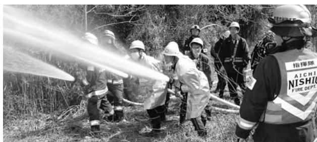
▶山林火災を想定した消防署・消防団合同訓練