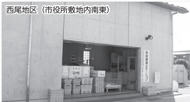
西尾地区（市役所敷地内南東）