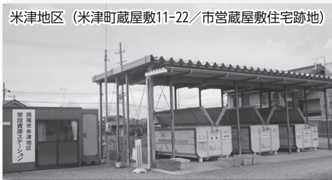
米津地区（米津町蔵屋敷11-22／市営蔵屋敷住宅跡地）