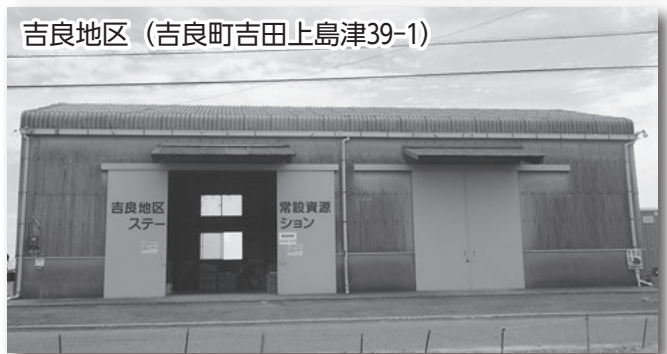
吉良地区（吉良町吉田上島津39-1）