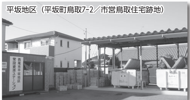
平坂地区（平坂町鳥取7-2／市営鳥取住宅跡地）