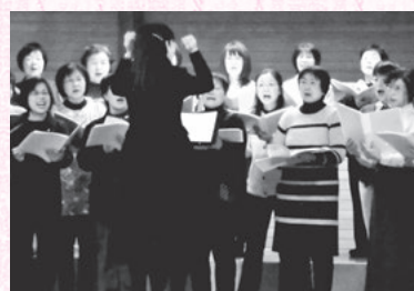
ドレミファコーラス