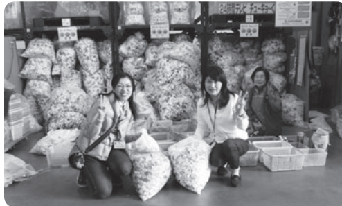
世界の子どもたちへワクチンを 贈るエコキャップ運動