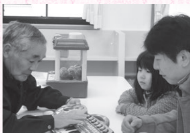
西尾おもちゃ病院

サークル活動や趣味の仲間と活動できます。情報サイトで仲間の募集やイベント情報を発信できます。