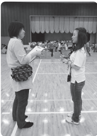
デンソー西尾製作所が 取り組む衣料回収活動