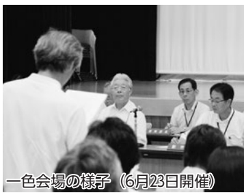
一色会場の様子 (6月23日開催)

市民の皆さんの声を市政に反映させるため、市政懇談会を開催しています。市長が各地区に出向き、市政運営の方針を説明するとともに、皆さんからまちづくりに関する意見・提案などをお聴きします。事前申し込みは不要で、どなたでも参加できますので、ぜひご参加ください。