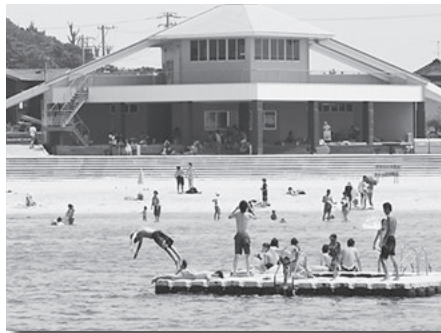
青い空、白い砂浜、透き通った水の大浦海水浴場で、夏を満喫しましょう！

いよいよ夏本番を迎え、海水浴の季節となりました。佐久島には大浦海水浴場があり、離島ならではのきれいなビーチに出会うことができます。夏の佐久島はイベントも盛りだくさん。ラッキーボール投げのほか、盆踊りや弁天祭りなど、島ならではの伝統的で、素朴なお祭りもあります。 海水浴の後には、西港近くの弁天サロンに寄ってみてはいかがでしょうか。古民家再生のシンボルと