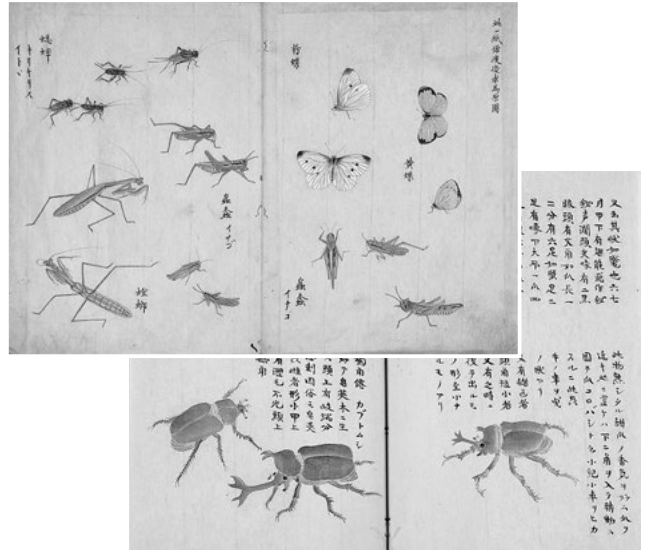
【上】『虫品』 【下】『栗氏千虫譜』