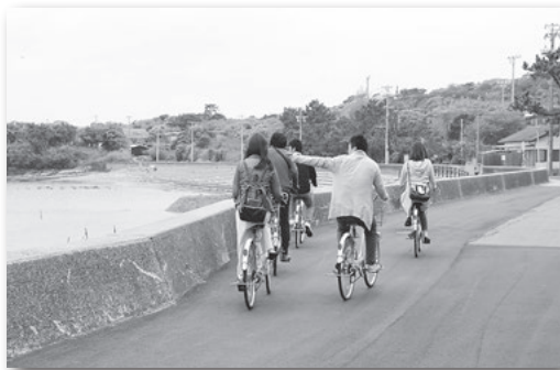
▲佐久島おでかけプラン「自転車でエンジョイ佐久島」。サイクリングが気持ちいいです。