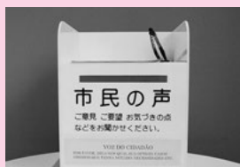
投書箱（設置場所により形が異なります）

より良い市政を行っていくために、市民の皆さんから広く意見や要望などをお聴きする「市民の声」という制度を設けています。