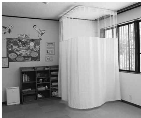
幡豆児童館2階「遊戯室」の授乳スペース

ご指摘の授乳室について、幡豆児童館2階の「遊戯室」にカーテンを設置し、授乳スペースを設けましたので、ご利用ください。（子育て支援課）