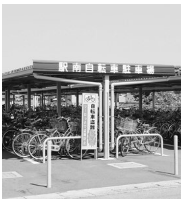
名鉄吉良吉田駅南自転車駐輪場

市では、自転車盗が多い自転車駐輪場への防犯カメラを順次設置しています。吉良吉田駅南自転車駐輪場にも防犯カメラを設置していきたいと考えています。なお、吉良吉田駅前に名鉄や民間が経営している有料自転車駐輪場があります。 (危機管理課)