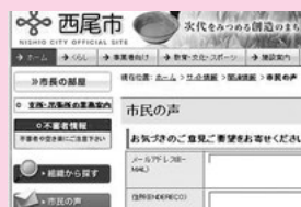
市ホームページ内の入力フォーム