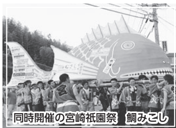
同時開催の宮崎祇園祭 鯛みこし