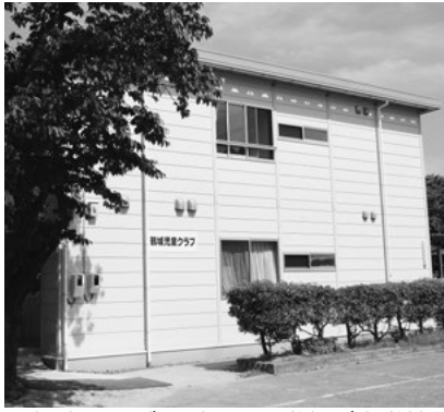
児童クラブの受け入れ学年が小学校6年生まで順次拡大されます

児童クラブの利用は今まで小学3年生まででしたが、子ども子育て支援新制度により、27年度から4年生まで拡大し、28年度は5年生、29年度は6年生まで順次拡大する予定です。夏休みなどの利用についても、通年利用と同様に拡大します。募集については、その都度広報紙などで案内します。なお、低学年の入会状況により定員を超えている