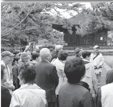
ツアーを企画したおもてなし大学Aグループの皆さん。受講生48人が考えた6つの提案の中から採用されました(上) 抹茶道場で立ち寄った、西尾の抹茶のルーツである実相寺(下)

した。そのときの模様をレポートします。 朝8時30分に市役所を出発し、抹茶道場(実相寺/あいや)、海鮮道場(巨海寿司)、えびせん道場(青山せんべい)、岡ノ山道場(道の駅にしお岡ノ山)と、西尾市の魅力を4つの道場に見立てたコースを巡りました。 なかでも海鮮道場の、地元の特産品である大粒の「あさり」をぜいたくに使った、おもてなしツアー限定のメニューは大好評！あさりの酒蒸し、三河湾の海の幸を使ったちらし寿司、抹茶を使ったデザートなど、参加