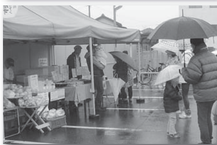
崎山集落から望む吉良ワイキビーチ(上) イベントに合わせて開催されたとば市の地元農産物や名産品などが並びます(下)

は、地元の商店などが出店する物産展「とば市」が行われていました。でもあいにくの雨。残念ながらお客さんはまばらでした。私は揚げたてのクロツケを買って食べました。芯まで冷えた体に染み入る温かさでした。今回の夢ウオークは、悪天候の影響もあり、参加者は4人ほどだったそうです。それでもスタッフの方々は、最後の参加者がゴールするまで待っていました。コースには数多くの案内看板が設置されていて、迷うこともなくゴールできました。本当に「ありがとうございました」の言葉しかありません。次回も参加するつもりです。でも、今度はすっきり青空がいいな。