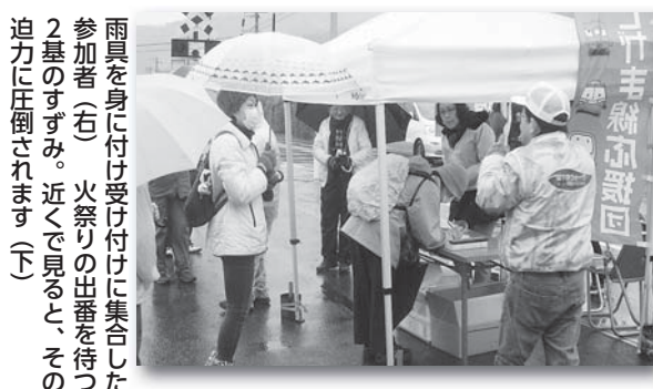
雨具を身に付け受け付けに集合した参加者(右) 火祭りの出番を待つ2基のすずみ。近くで見ると、その迫力に圧倒されます(下)

2月8日に行われた第30回は夢ウオーク「鳥羽の火祭りコース」に参加しました。そのときの模様をレポートします。夢ウオークは、四季の移ろいを感じながら、幡豆地区の