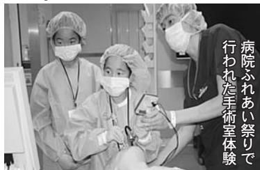
病院ふれあい祭りで行われた手術室体験

答 大好評のちびっ子体験や健康よるず相談の実施回数を増やし、現在は、3年に1度の病院ふれあい祭り開催についても見直しを検討する。