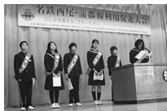
本年度は蒲郡市で行われた名鉄西尾・蒲郡線利用促進大会

答 名鉄西尾・蒲郡線利用促進大会を始め、沿線での各種イベント開催、そして、市民にこの路線が、この地域になくてはならない交通機関であることを認識してもらいたいと考えている。