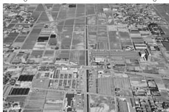
「農業副都心」構想エリアとなる福地南部地域

答 民と官がそれぞれ役割分担に応じた責務を果たしながら、実現に向けて努力すべきであると考えている。各界各層の皆様から多様なご意見、ご要望をいただきながら魅力的な整備計画を策定していく。