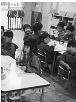
充実が求められる 低年齢児保育や特別保育