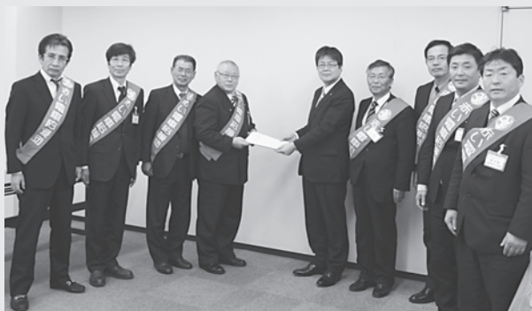
名古屋鉄道に「要望書」を提出する 西尾市・蒲郡市の両市議会議長ら

名鉄西尾・蒲郡線の存続問題は依然厳しい状況ですが、市議会も鋭意努力してまいりますので、市民の皆さんも引き続き「乗って残す」べく、ご理解とご協力をお願いします。