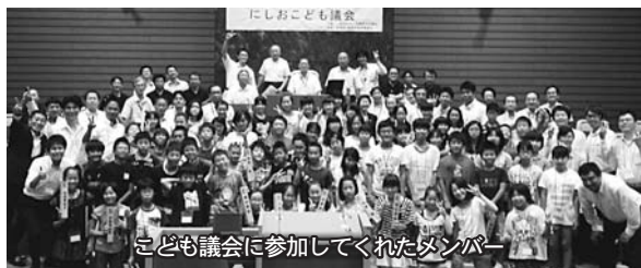
にしお子ども議会 子ども議会に参加してくれたメンバー

答 現在のところ、市が主体となり定期的に子ども議会を実施していくことは考えていない。しかし、社会科学等の政治を学ぶ学習の中で、市議会の見学や市への提言など、子どもたちの学びの必要に応じ