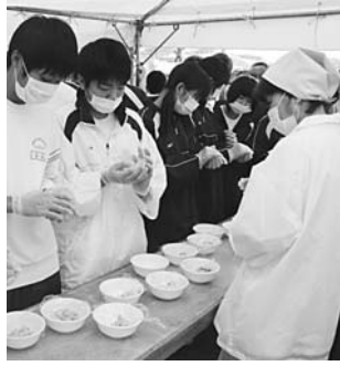
防災訓練で炊き出し訓練に参加する一色中学校の生徒の皆さん

答 合計3210人が参加。中学生が炊き出しや避難所開設訓練を実施して予想以上の戦力になると実感した。また、自衛隊、海上保安庁、警察、消防、自主防災会等による訓練では、国と防災関係機関との連携強化や地域の防災体制の確立、住民の防災意識の高揚を図ることができた。