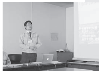
視察地の職員から説明を受ける

ふるさと納税制度は、活用の仕方によっては、地域活性化が図られるとともに、寄附者、地元の農商工業者、行政の三方よしになり得る制度です。先進地の取り組みを大いに参考にして、西尾市への導入について考えていきたいと思ひます。