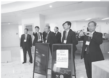
那珂川町では現地視察も実施

行の減少や学力向上の面から考えても有意義であり、実現に向けて検討していく価値のある制度であると感じました。