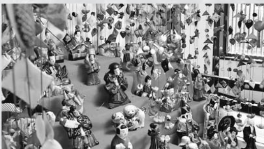
▲佐久島の雑まつり展の様子。温かみ溢れる素朴な土雑が、皆さんを迎えてくれます。

三河・佐久島アートプラン21が始まってから、14年が経過しました。その間、島内に常設展示されるようになったアート作品の数は20。佐久島88か所弘法巡りも現代風な祠が建てられ、アートな弘法巡りとして復活しました。 常設展示作品の中でも代表的なものは、佐久島大浦湾を挟んで対峙する白と黒のボツクス。佐久島東地区大島へ至る栈橋にある白の「イーストハウス」と、西地区の石垣海岸にたたずむ黒の「おひるね