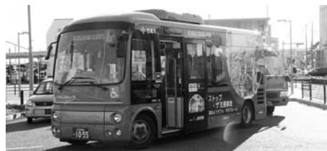
六万石くるりんバス(写真は市街地線を走るバスです)