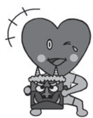
市食育キャラク ター・ハートン

対 市内在住または在勤の方 時 1月22日(日) 午前10時～午 後1時30分 場 一色町公民館 内 農業者が講師となり、地元 農畜水産物を使い、2種類 の恵方巻き、ダイコンの甘 酢漬け、ロールケーキを作 ります。 定 20人 ¥ 12000円 講 西尾市生活改善実行グルー プ連絡研究会 申 12月28日(水)までに、郵便 番号・住所・氏名・電話番 号を、直接またはファクス、 Eメールで農林水産課農畜 産担当(☎65・2135 / FAX 57・1322 / nousun @city.nishio.g.jp)へ。申 込期間内に定員を超えた場 合は抽選。電話での申し込 みはできません。