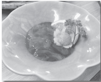
珍味「コノワタ」。島の冬の風物詩です。