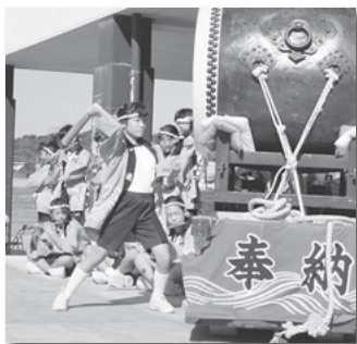
昨年の佐久島太鼓フェスティバルの様子。島中に和太鼓の音が響き渡ります

東港で下船し、島の南東に向かって歩いていくと新谷海岸があります。砂浜はムール貝の砕けた貝殻が堆積し、薄紫色をしているので、とてもロマンチックです。海岸の東側には約2500万年前に堆積した美しい地層が広がっていて、自然の雄大さを感じられます。新谷海岸から筒島を目指して歩くと、その途中に平古古墳があります。島内には多くの古墳があり、縄文・弥生式の土器片が多く出土しています。島に人が住み始めたのは、紀元前3000年前といわれ、その時代の人たちがどこから