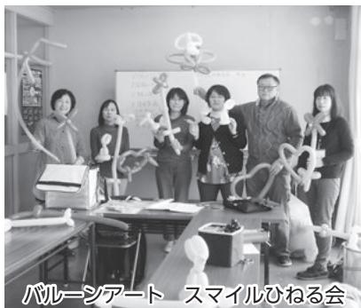
バルーンアート スマイルひねる会