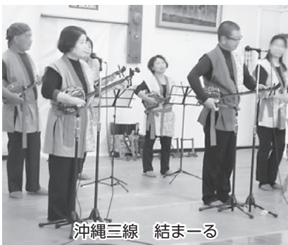
沖縄三線 結まーる

登録方法 申請書を直接アクティにしおへ。申請書はアクティにしおに用意。ホームページからもダウンロードできます。