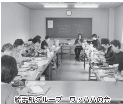
絵手紙グループ ワッハハの会