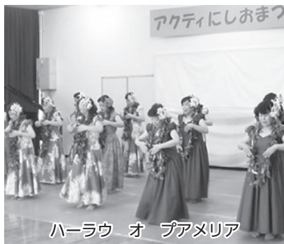
ハーラウ オ プアメリア