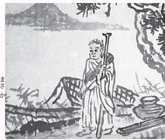
▲天竹神社に伝わる天竺人の図

天竹町天竹神社の棉祖神(棉神さま)のお話を をご存知でしょうか。平安時代の延暦18(79 9)年、三河国に小舟で一人の異国人(天竺人) が漂着した。布を体にまとい、禪をつけ、耳が 長い。一弦琴を弾き、悲しい歌を歌う。所持品 の中に棉の実があり、天皇の命で各地に配られ て栽培された。これが国内の綿栽培の始まりで ある」という話です。