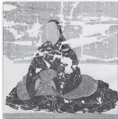
「禅定尼像」華蔵寺蔵 美しい打ち掛けを着て数珠を持つ女性の肖像画。その正体は？